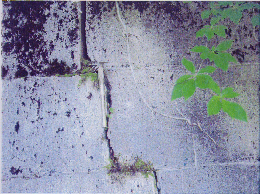
図-4-12 ⑥の地すべり内の道路擁壁に見られる亀裂